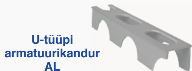
U-tüüpi armatuurikandur AL