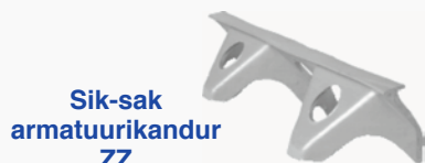
Sik-sak armatuurikandur ZZ