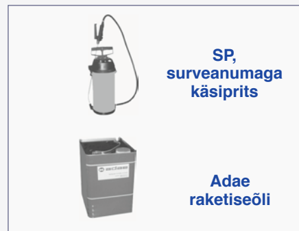
SP, surveanumaga käsiprits