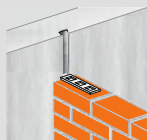
Betoonseinte ühendamine müüritisega